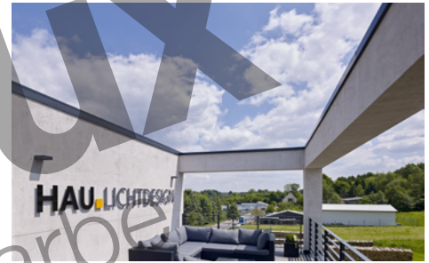
Brillux Mineral-Leichtputz G 3679, Farbton 12.03.12